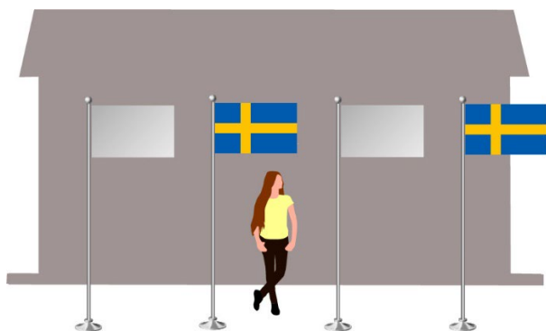
Figuren ovanför visar den svenska flaggans placering vid flaggning på fyra flaggstänger.

Om det finns flera flaggstänger ska den svenska flaggan alltid ha hedersplatsen i mitten. Vid jämnt antal flaggstänger placeras den svenska flaggan till höger från mitten, när man står med ryggen mot den plats eller byggnad där flaggstängerna finns.