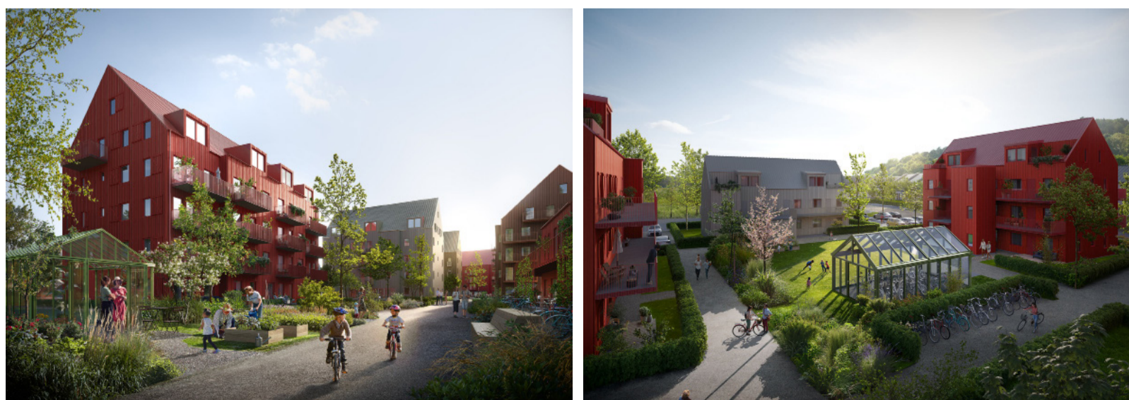
Förslag på gestaltning av flerbostadshuset (Semrén & Månsson, 2024)

I Anneberg planeras ett kommundelscentrum med 300 bostäder, mötesplatser, centrumlokaler, vård- och omsorgsboende, förskola och bibliotek. Byggnationen kräver nya gator och infartsväg från Norra Annebergsvägen. Längs Kungsbackaån planeras en gång- och cykelväg. En ny cirkulationsplats vid Älvsåkersvägen ska höja trafiksäkerheten.