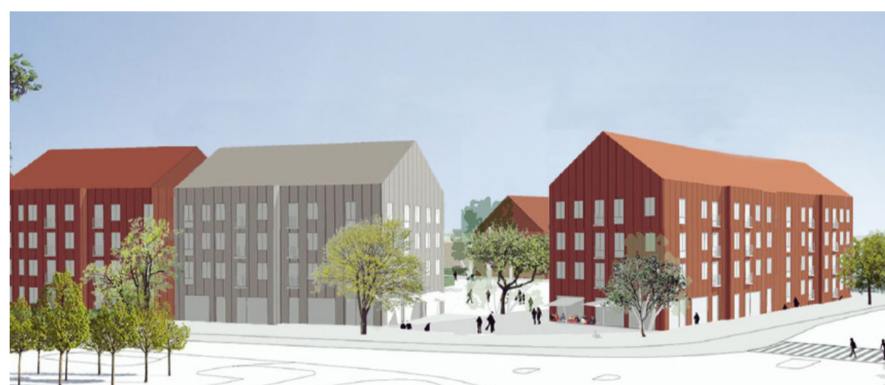
Vy från korsningen Norra Annebergsvägen/Älvsåkersvägen (Semrén & Månsson, 2024)