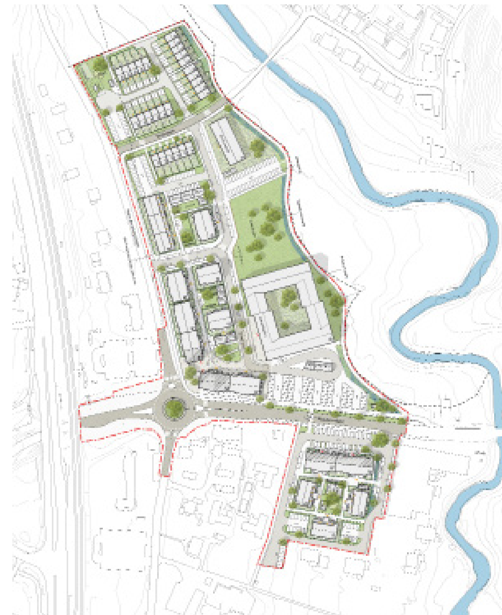
Illustration av planförslaget med ett nytt kommundelscentrum i Anneberg (Semrén & Månsson, 2024)