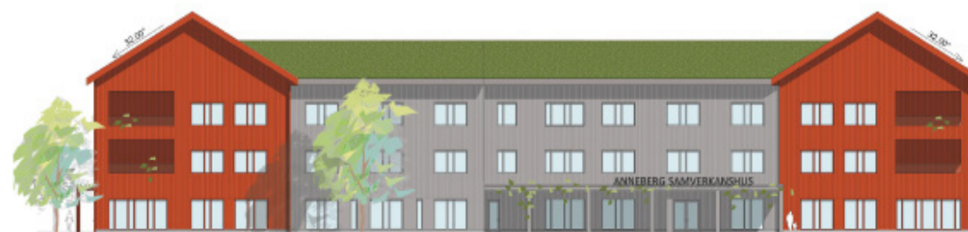
Sektion av fasad mot torget i öster med huvudentré till samverkanshuset (Abako, 2024).