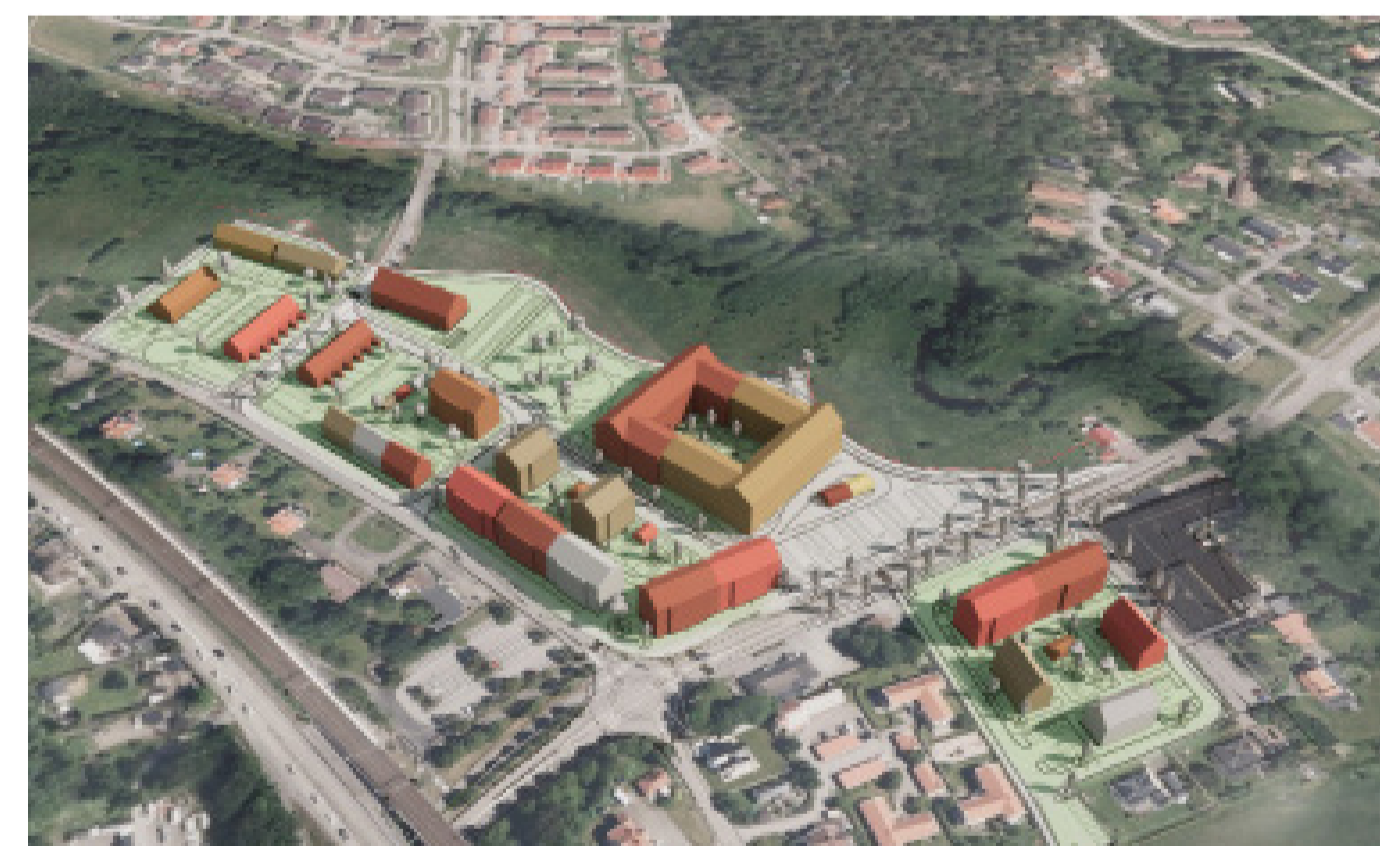
Volymstudie av planförslaget (Semrén & Månsson, 2024)