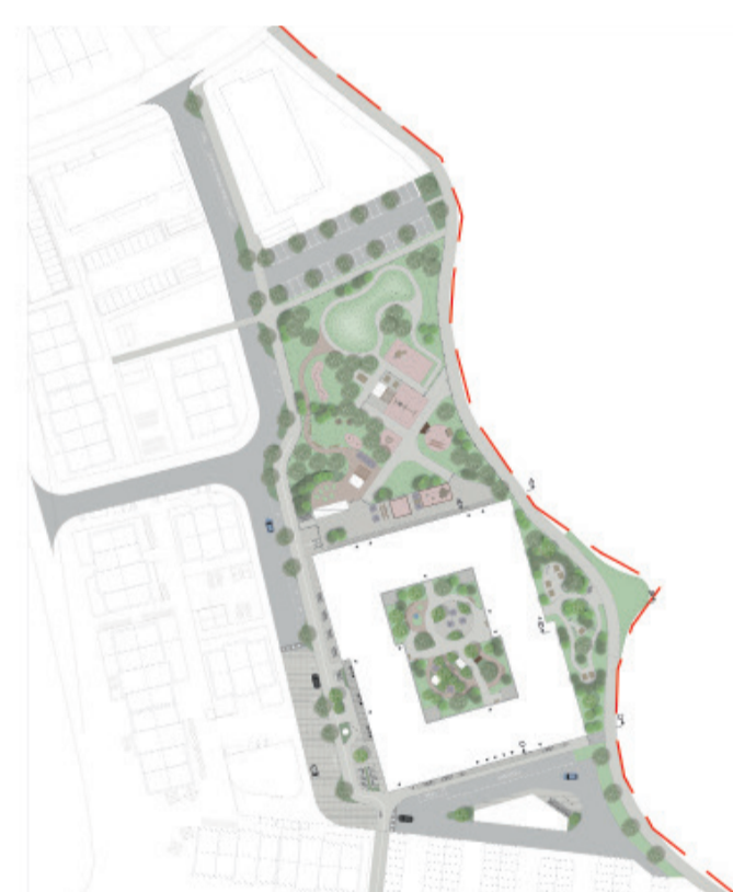
Illustrationsplan över samverkanshuset och förskolegården (Abako, 2024)

Förskolegården kan användas av allmänheten på kvällen och helger (Kreera, 2024)