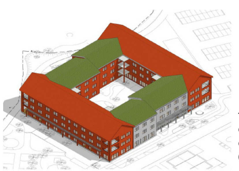
I samverkanshuset finns förskola, vård- och omsorgsboende och bibliotek (Abako, 2024).

Förskolegården kan användas av allmänheten på kvällen och helger (Kreera, 2024)