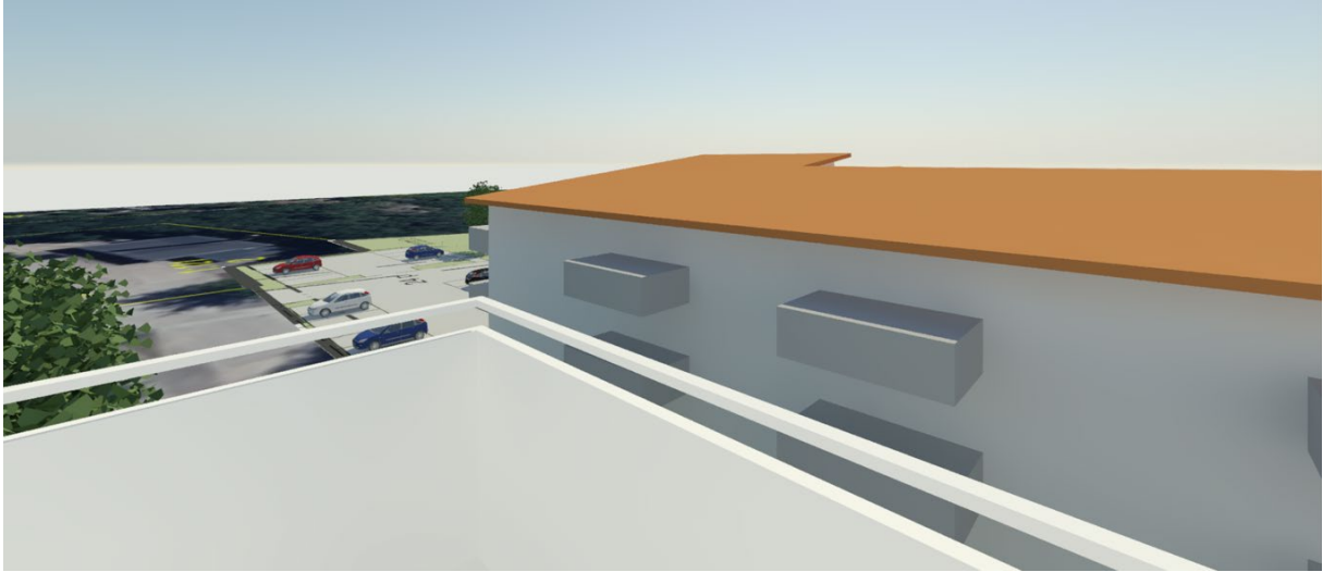
Figur 7. Vy från balkong, våning 4, Särö Centrumväg 7, mot sydost.