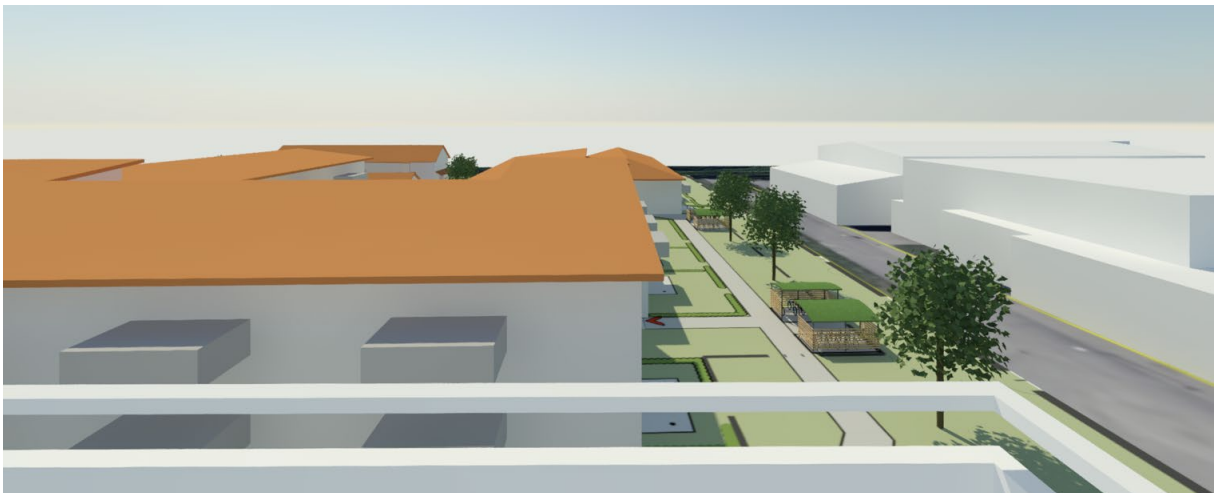
Figur 5. Vy från balkong, våning 5, Särö Centrumväg 7, mot söder.