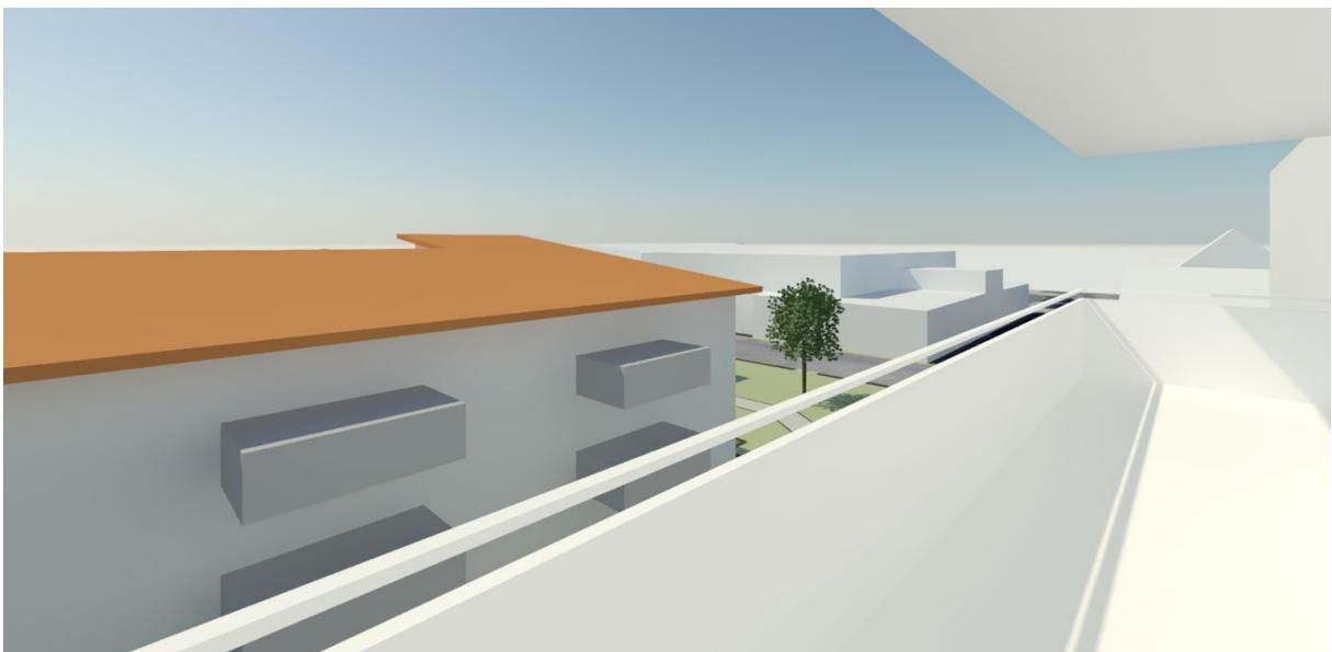
Figur 9. Vy från balkong, våning 4, Särö Centrumväg 7, mot sydväst.