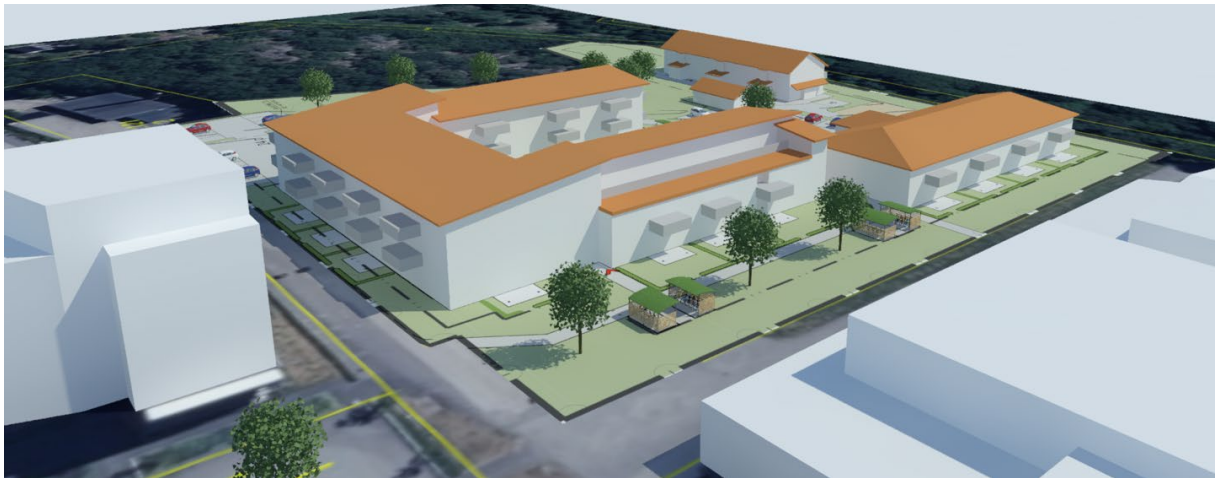
Figur 1. Vy från nordväst.

Befintlig byggnad, tidigare äldreboende, byggs på med en våning.