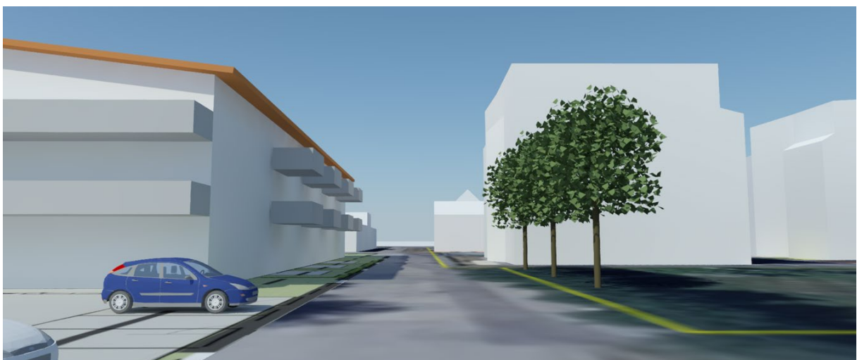
Figur 3. Gatuvy mot väster, mellan Bukärrsgården och Särö Centrumväg 7.