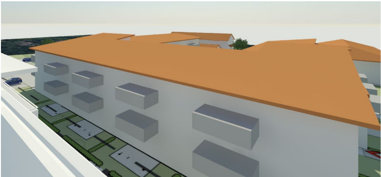
Figur 6. Vy från balkong, våning 5, Särö Centrumväg 7, mot sydost.