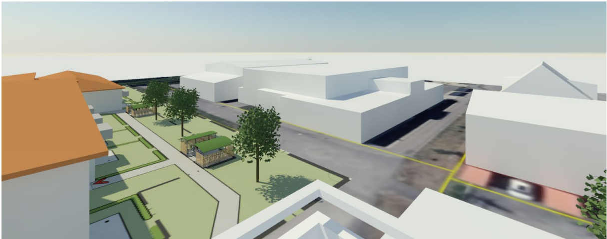
Figur 4. Vy från balkong, våning 5, Särö Centrumväg 7, mot sydväst.