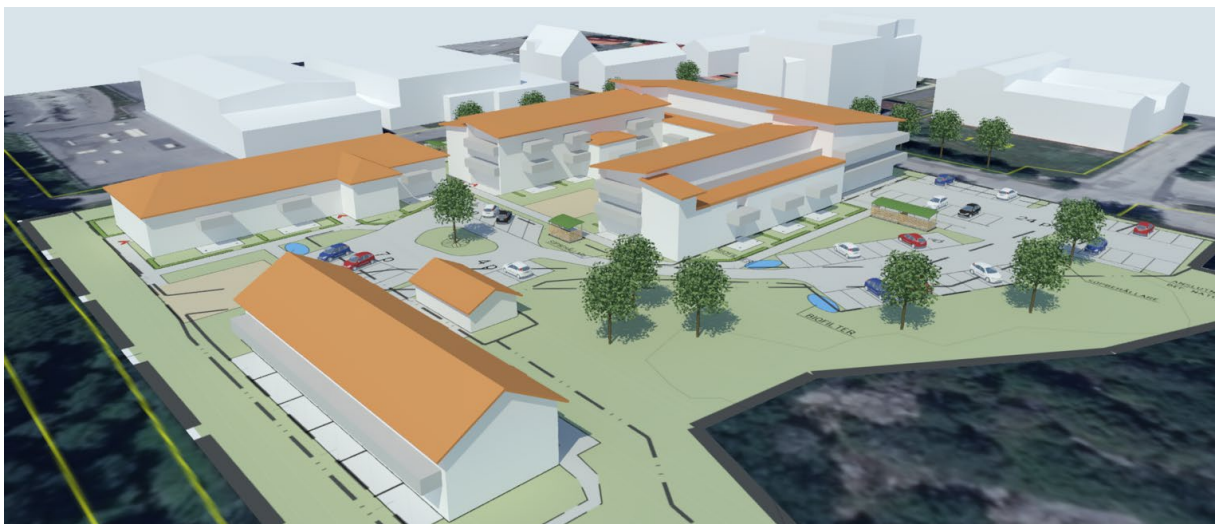
Figur 2. Vy från sydost.