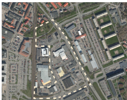
Planområdet (streckad linje).

Genom att omvandla området till blandad stadsbebyggelse med tydligare stråk genom området samt med stärkta kopplingar till