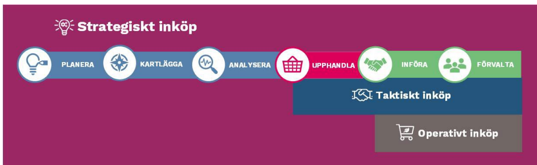
Bild: Kungsbacka kommuns visualisering av strategiskt inköp

Strategiskt inköp är hur inköpsprocessen förhåller sig till strategiskt, taktiskt och operativt inköp. Detta förhållningssätt är en förutsättning för att arbeta med inköp på strategisk nivå.