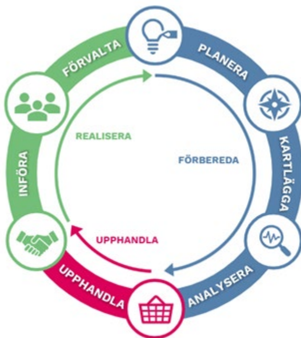
Bild: Kungsbacka kommuns Inköpsprocess

Inköpsprocessen innehåller faserna förbereda, upphandla och realisera.