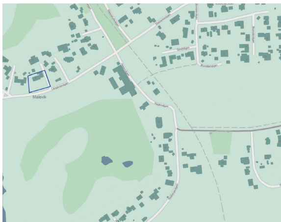
Planområdet (blå linje).

Området planeras med utgångspunkt att befintlig huvudbyggnad och komplementbyggnad ska vara planerliga. Tillåten nockhöjd och taklutning utgår därför ifrån den bebyggelse som finns inom fastigheten idag. Utöver detta möjliggör detaljplanen för en tillbyggnad av huvudbyggnaden åt väster. Här begränsas dock den totala höjden för att hindra en tillbyggnad i två plan.