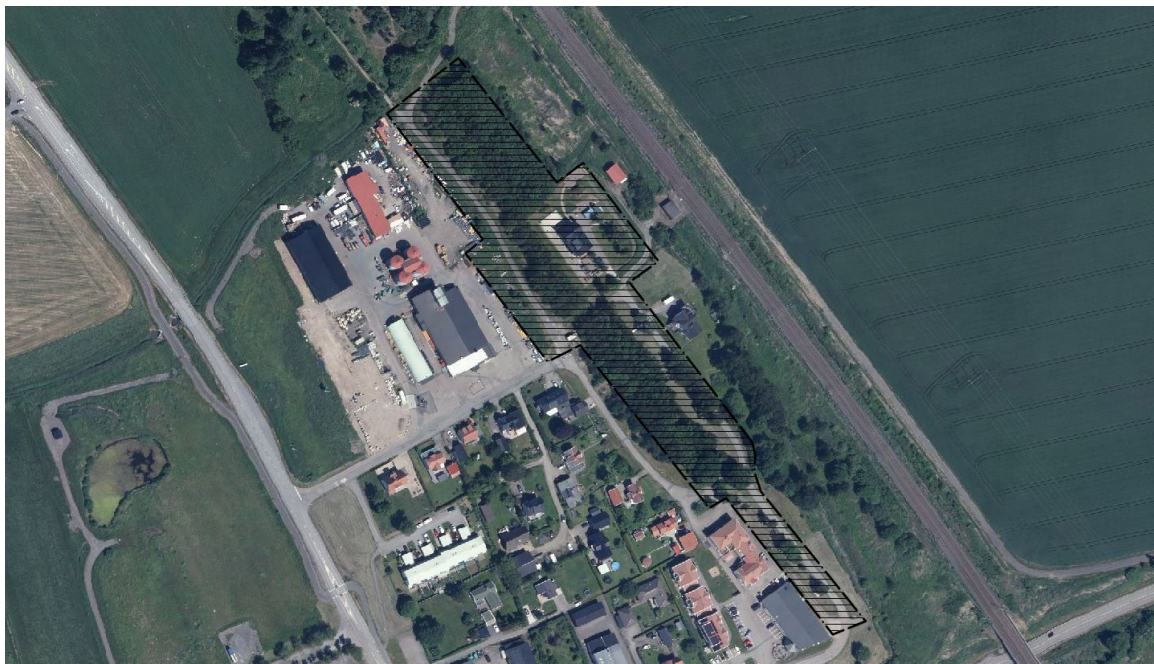
Planområdet markerad med svart skrafferad yta

Detaljplaneförslaget innebär att del av gällande detaljplan FJ9 upphävs och därmed slutar att gälla. Det område som omfattas av detaljplanen kommer därefter att ligga utanför planlagt område.