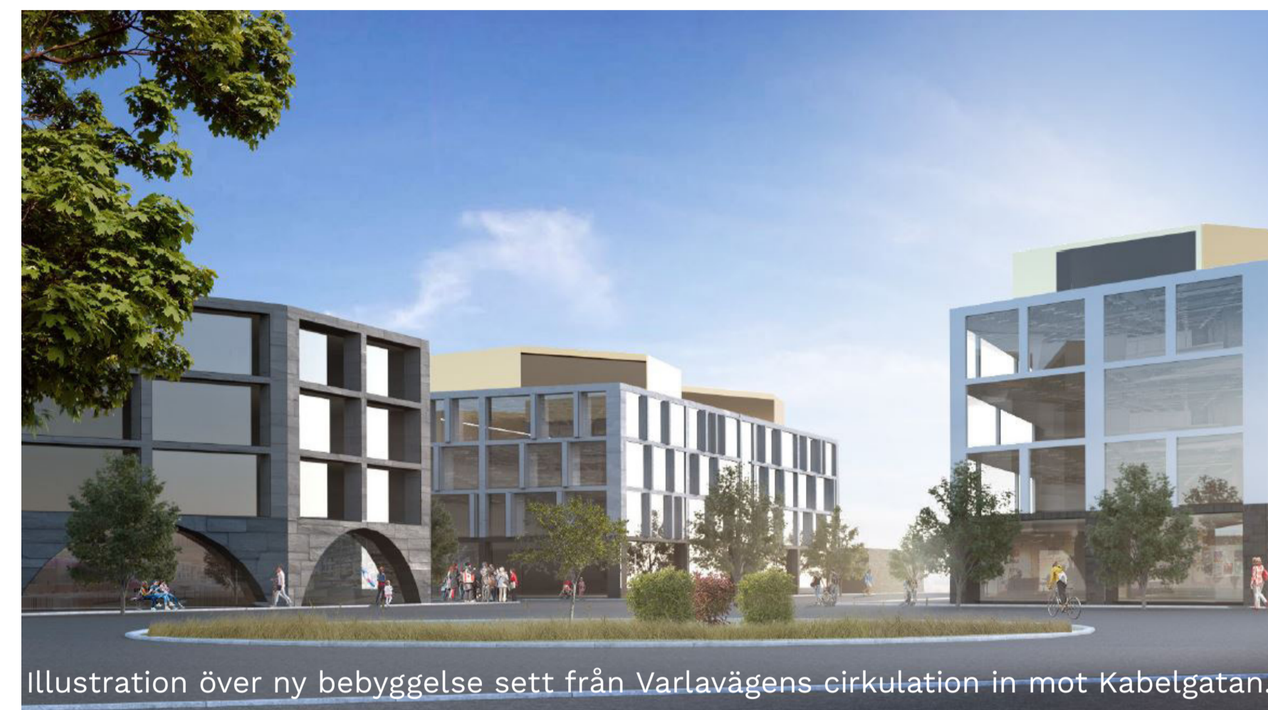
Illustration över ny bebyggelse sett från Varlavägens cirkulation in mot Kabelgatan.

Parallellt med detta projekt pågår ett planarbete för del av Varlavägen med syftet att skapa fyra körfält för bil.