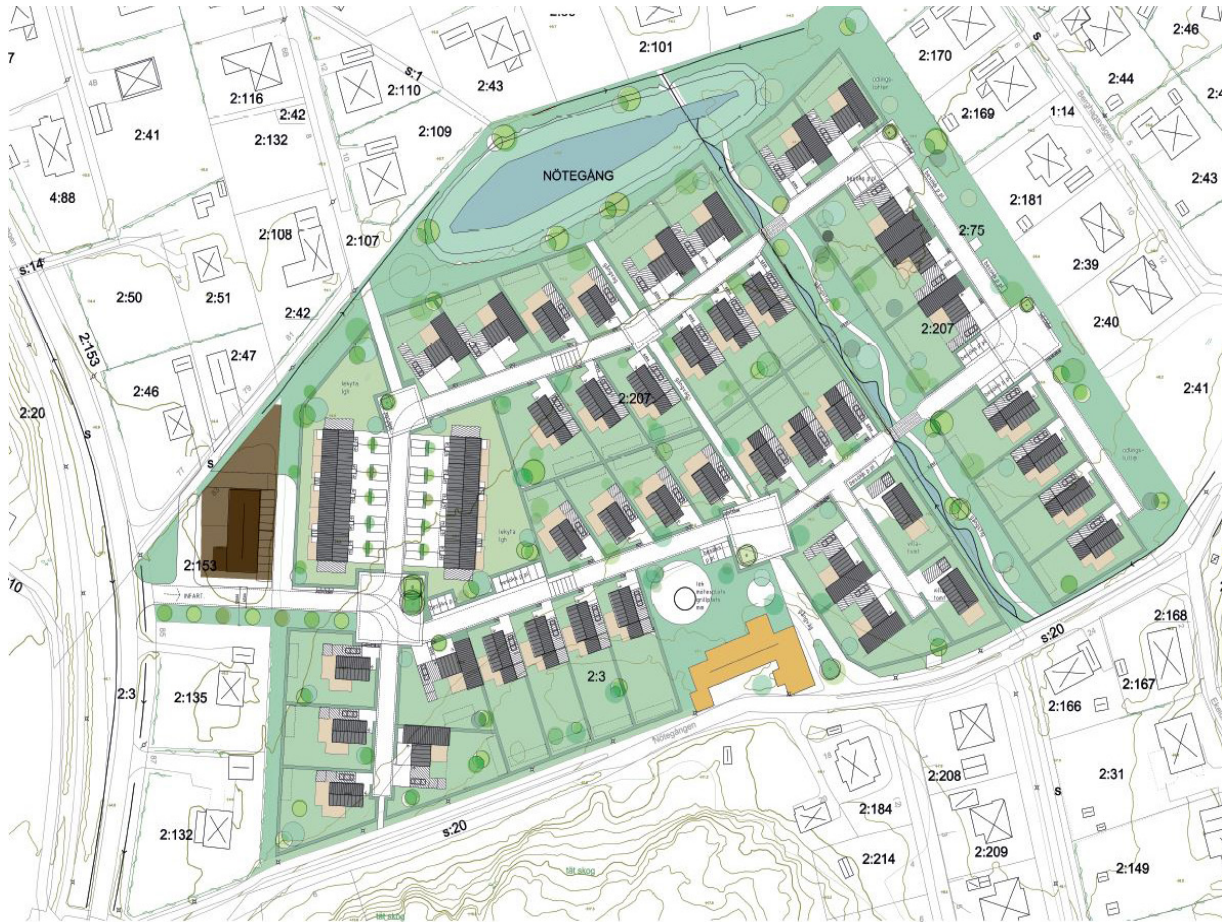
Illustration över detaljplanerområdets utformning

Nötegång 2:207 m. fl. detaljplanläggs för bostäder i varierande upplåtelseform. Nötegång 2:153 har tagits med i planområdet för att planläggas för verksamheter samt infartsväg till området. Till planområdet inkluderas även ett dagvattendike som rinner in i området söderifrån.