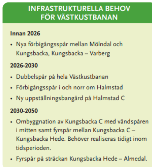
Figur 2 - Region Hallands redovisning av de infrastrukturinvesteringar på Västkustbanan som krävs för att kunna möta de resbehov som identifierats