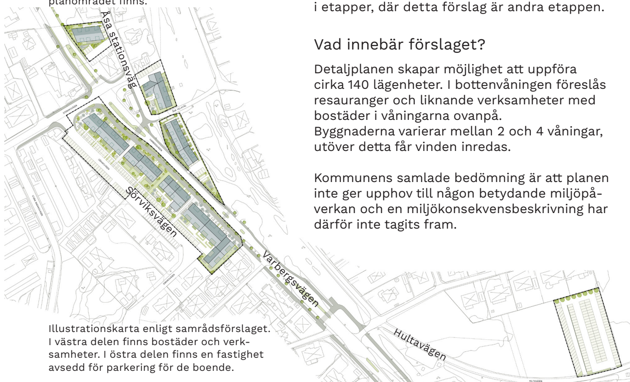
Illustrationskarta enligt samrådsförslaget. I västra delen finns bostäder och verksamheter. I östra delen finns en fastighet avsedd för parkering för de boende.

Kommunens samlade bedömning är att planen inte ger upphov till någon betydande miljöpåverkan och en miljökonsekvensbeskrivning har därför inte tagits fram.