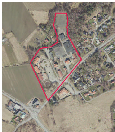
Planområdet redovisat med röd linje.